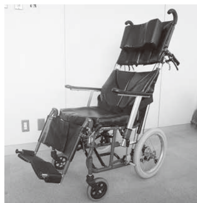
リクライニング車イス