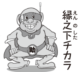
縁 えん 之 の 下 した チ チ カ カ ラ