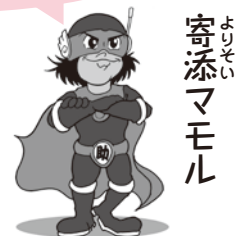
寄 よ 添 り マ マ モ モ ル