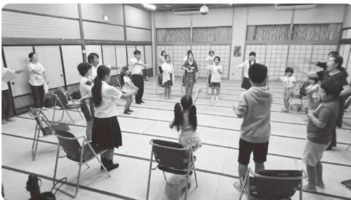
一般公開の練習風景

毎年菊川市内の敬老会や文化展などの催しで、地域の方から大きな拍手や暖かい声援をいただき、歌うことの楽しさと歌を通して、地域で触れ合うこと、地域貢献などの大切さを肌で感じております。子供たちの健全な心と体の成長の励みになるような活動を目指しています。