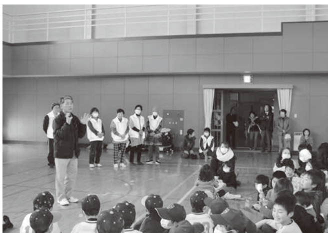
地域サポーター 2月 豆まき会の様子