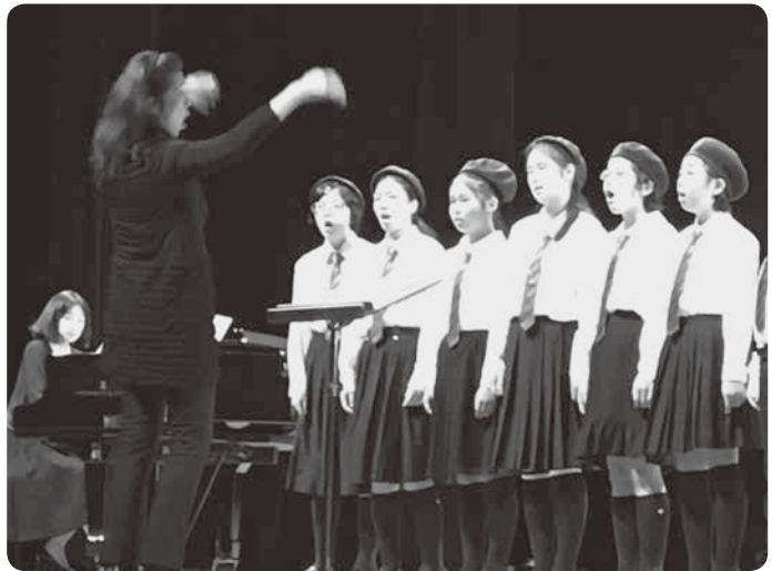
アエルの発表の様子