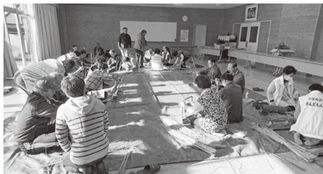
地域サポーター 11月 地の神様づくりの様子

1年半前に大きな病気を患いました。現在は体調と相談しながらですが、無理をしないように今やっていることを長く続けていきたいです。せつかくの人生なので、楽しくしていないとつまらないと考えて明るく元気に頑張りたいです。