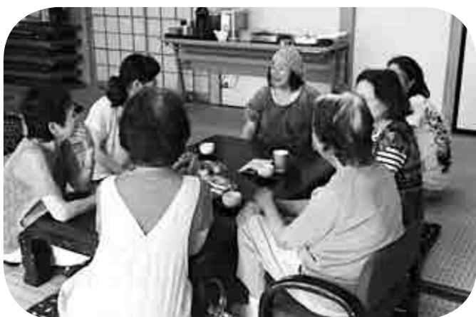
おしゃべりカフェみなみやま