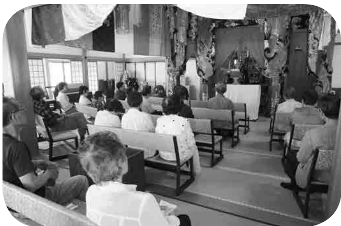
またきてカフェin報恩寺