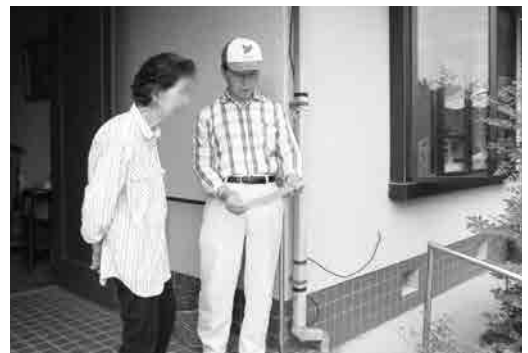
みんなみだよりを用いた訪問活動

広報誌みんなみだよりを発行し、サポーター全員で近所の高齢者宅に持参し見守り活動をしています。現在83号まで発行していますがお年寄りの方に好評です。救急医療情報キット配布は消防署との連携で実施しています。一人住まいや高齢者世帯の万が一に備え既往歴やかかりつけ医等を記録して保管、救急搬送時の資料として頂くよう配布しています。