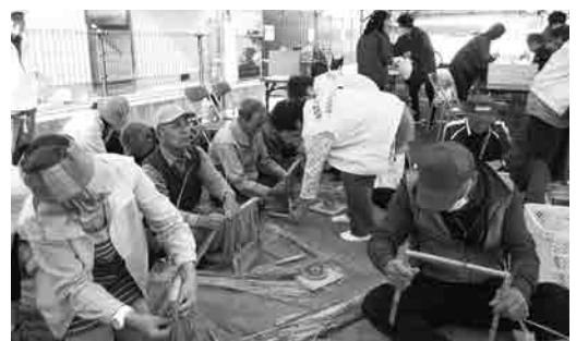
みなみやま会館祭りの地の神様づくり

昔から行われてきた神事の伝統をつないでいこうという考えで、会館まつり等で地の神様作りのイベントを実施しています。また、正月飾りも自分で作った物を飾れるよう習得に励んでいます。