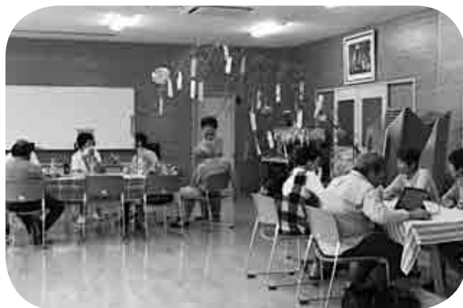
オープンくすりん