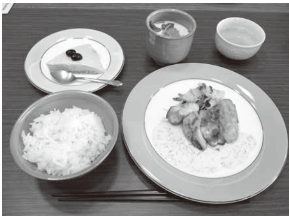
乳製品を使った料理