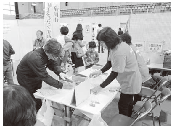
かつお節削り体験