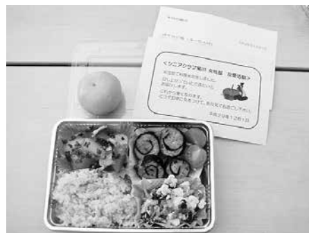
お届けしたお弁当