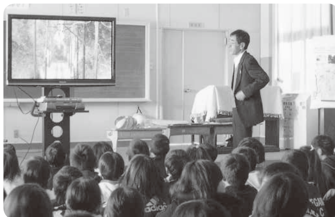
内田小学校ふれあいフェスタにて講話

色々な活動をしている中で、新しい事を目にし、新しい人と出会い、その人の考えを知る事は、新鮮な事だと思います。