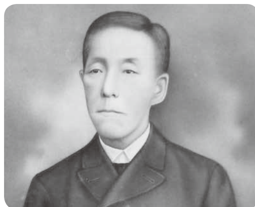
初代県知事 関口隆吉