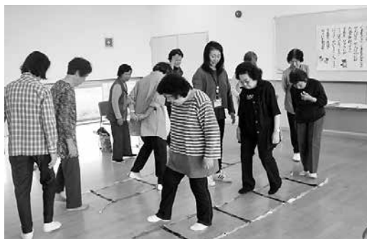
「コグニサイズ」の様子