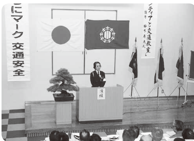
旧菊川町交通指導隊総会の様子

30数年、交通指導隊としてやっていました。冬場の早朝の交通指導など、今思うと足の指先の凍るような時間を思い出します。大変なこともありましたが、交通指導隊をやらせてもらい、知らない人は居ないくらいになり、今でも外へ出ればみんなに声を掛けてもらえます。家の家業の床屋さんをやりながらのボランティア活動でしたが、楽しいことがいっぱいでした。あの頃は子どもも素直で、やっていること自体が楽しかったです。