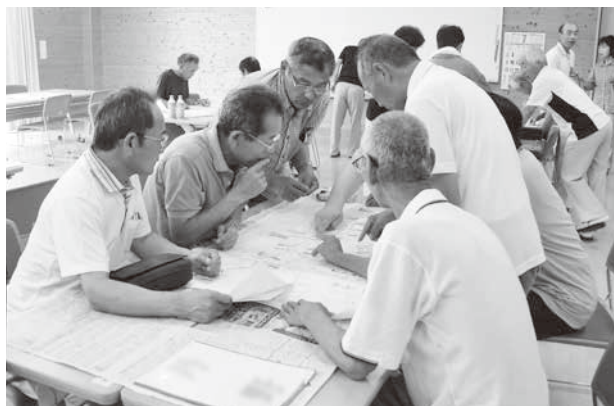
福祉見守りマップ作業の様子

7月9日（日）小笠東地区センター『くすりん』において、小笠東地区福祉見守りマップ更新作業が行われました。