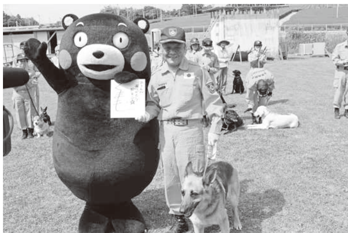
くまモンから色紙をもらいました