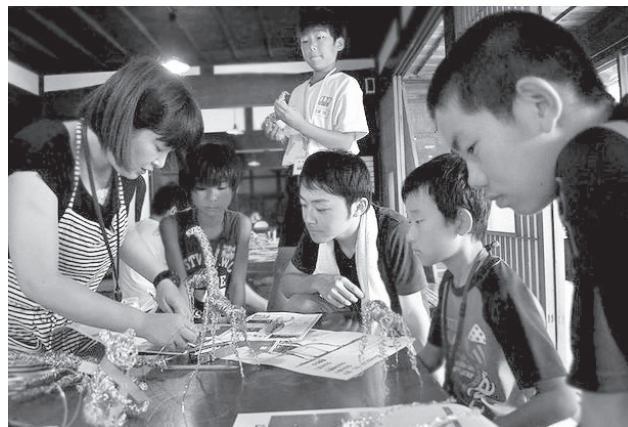
ジュニアワークショップ×古民家