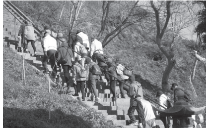
浅草山観音堂参道

参加者38名程が、東京・浅草の浅草寺の分院として知られる浅草山観音（南山）に出会い、県の指定文化財（史跡）に指定されている舟久保古墳の歴史に触れ、冬場の暖かい日差しを浴びながら、歴史を感じるウォーキングを楽しみました。