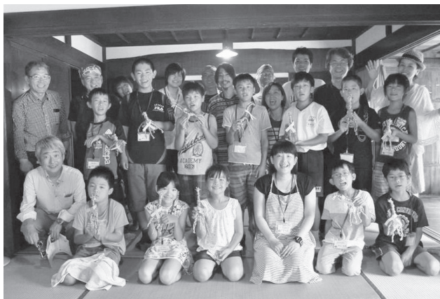
若手アーティスト×彩りアート