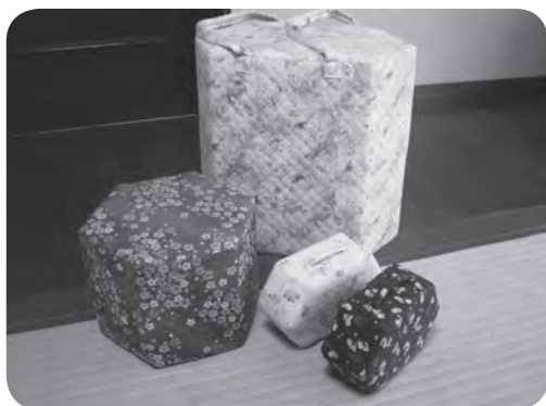
牛乳パックを利用して作った椅子

私は車が好きで一人でよくドライブをしています。カメラも好きなのでいつもカメラ持参で、風景を撮ったり楽しんでいます。自分一人の時間を満喫できるのでとても楽しい時間を過ごしています。