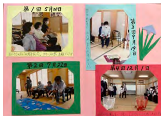
手作りのアルバム

立ち上げ当時、高齢者にとって地域での楽しみは何だろうと考え、「みんなで集まり、おしゃべりをしながら過ごせる場所を作りたい」という思いからこの会が始まりました。会の名前には、懐かしいお母さんの味「おにぎり」への思いと、みんなで手を握りあって楽しく過ごせる会にしたいという二つの思いが込められています。