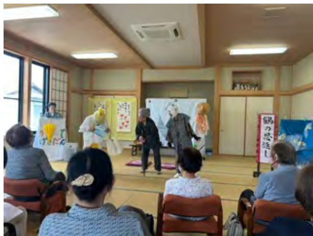
おかって劇団による楽しい演劇

活動では、出前講座やボランティア団体による演奏などを中心に、健康体操やレクリエーションも毎回取り入れ、頭と体を無理なく使うことを心掛けています。毎年11月には西方こども園との交流会も行われ、子どもたちの笑顔に元気をもらう楽しい時間となっています。また、活動の様子をアルバムにまとめて参加された方々へお渡ししたり、手書きの案内チラシを作製したりと、人と人の繋がりを大切にしたい温かい活動が続けられています。こうした取り組みもあり、参加者からは「楽しかったよー!」「また来るでね!」といった声も聞かれ、活動を続ける励みになっているそうです。