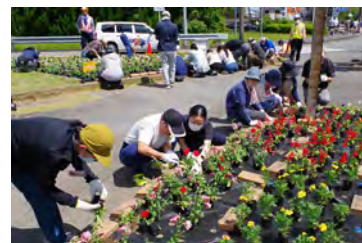
おっ撮りカメラ隊撮影

5月30日(土)に「ふれあい企画」を実施しました。この企画は障がい者と学生ボランティアが菊川インター前の美化活動を通して交流し、障がいへの理解を深め、地域福祉の推進を図ることを目的に、社会福祉法人Mネット東遠、社会福祉法人草笛の会、中日本高速道路株式会社、ボランティア等の協力を得て開催しています。今回は、静岡英和学院大学、聖隷クリストファー大学や東海アクスス専門学校、個人ボランティアの10人が参加されました。マリーゴールドや日日草、ペチュニア等たくさんのお花を植えました。今回は例年通り社会福祉法人草笛の会様からお花を購入し、中日本高速道路株式会社様からたくさんのお花をいただきました。大勢の協力により素敵な花壇になりました。参加された学生からは、「花植えを通して、自然と会話がうまれ交流の大切さを感じた」「色々な方と話すことができ、良い経験になった、また参加したいです」等の意見をいただきました。お近くにお越しの際は、ご覧ください。