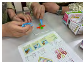
アイロンビーズ作り

ふらっとスペースに参加してみたい、関心があるという方は、ぜひお問合わせください。