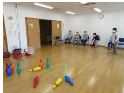
笑いっぱい bowling 😊