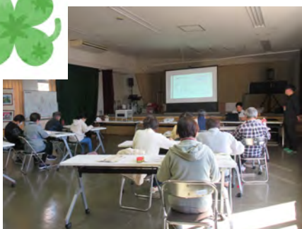
「わたしの避難計画&マイタイムラインを創ろう」 受講