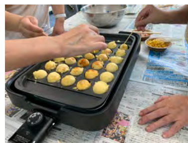
みんなでたこ焼き作り♪

第2. 3火曜日 13:30～15:30・・・ワークショップ（クラフトやクッキング）