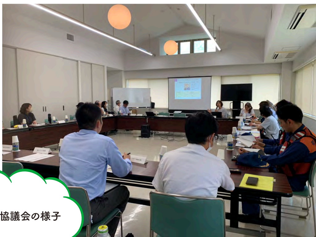
居住支援協議会の様子

社会福祉協議会が進める地域福祉事業やボランティア活動を推進する上で、地域の皆さまからの会費やご寄付が大きな支えとなっており、大切に活用させていただいております。今後とも皆さまのあたたかいお気持ちをお寄せくださいますよう、よろしくお願いいたします。