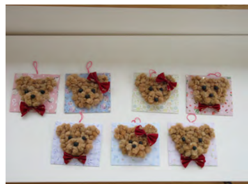
綿で作ったクマの壁飾り