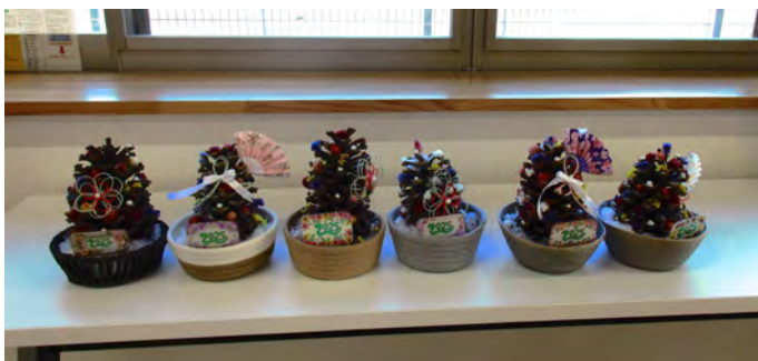
大きな松ぼっくりの飾りつけ