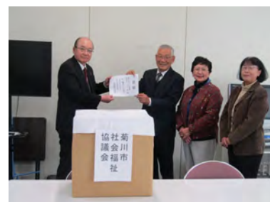
静岡県退職公務員連盟 小笠支部