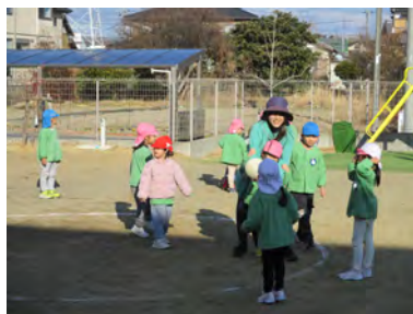
一緒に、ドッジボール楽しいね！

毎日子どもたちの違う姿を見られることが楽しいです。同じ活動をしていても声掛けによって子どもたちの反応が全く異なり、この声掛けだと盛り上がるな、この声掛けだと、この子にはあまり響かないな等の発見があります。自分のやろうとすることに自信が持てない子や、すぐに出来ないと言う子に、「できないことがあっても良いんだよ。まずはやってみよう」と伝えているうちに、「自分がやるところを見ていて」と挑戦してくれるようになりました。「先生！できた！」と喜ぶ姿を見ることができた時はとても嬉しかったです。