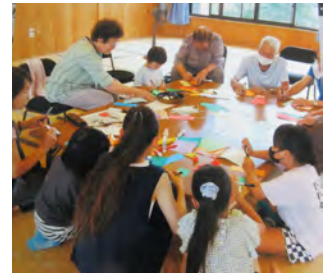
七夕まつりの様子

私達のサロンも今年度限りで一応の幕を降ろします。平成24年から長い間、赤い羽根共同募金の助けを借りて、活動を続けてきました。本当にありがとうございました。一人では出来ない事も、仲間がいてくれたおかげでやってこれました、感謝です。立ち上げた当所とは、福祉の状況も変わり、随分充実して来た様に思います。これからは、地域の皆さまと共に、楽しい毎日が過ごせる様に頑張ります。