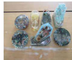
手作りの小物入れや作品