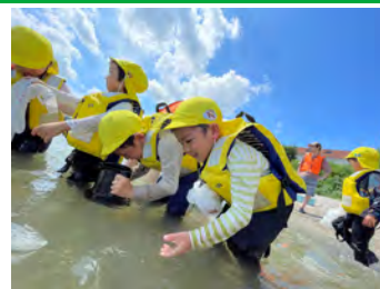
海の中の生き物探しに夢中～！

6月に子どもたちと一緒に1泊2日の三ケ日自然体験に行きました。湖岸観察で海の中の生き物を観察したり、ライフジャケットを着て海の中に入ったりして楽しみました。夜のキャンプファイヤーや花火は、子どもたちも大盛り上がりでした。子どもたちにとっては初めての経験、初めてのお泊り。不安な気持ちもある中、仲間がいるから大丈夫！と友達と一緒に色々なことを乗り越え、また一歩成長した姿が見られました。