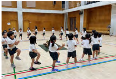
みんなで輪になって踊ろう！

私は社会福祉法人愛育会認定こども園西方こども園に勤めております。当園は、「その子らしさが光り、前向きに葛藤し、やり抜こうとする子」を目標とし、保育に勤めています。保育をしていく中で子ども自身が、「自分ってなかなかいいぞ」と自信をもって自分の世界を広げていけるように、「ともだちっていいな」と相手思いやる気持ち、仲間の大切さを感じられるよう日々の保育を考えて行っております。現在は毎年行われる『からだの日』に向けて、子どもたちがやってみたいことを一緒に考え、活動に取り入れています。歌うこと、踊ることが好きなので子どもたちと共に楽しんでいきます。