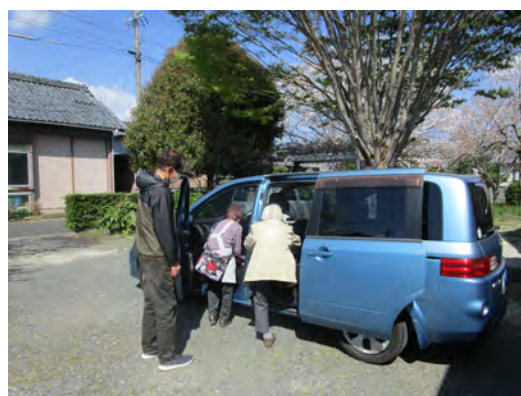
帰りの送り・今から自宅まで送ってくれます