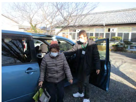
朝のお迎え・今からお楽しみみのサロンです

今年は、忘年会・総会もできることを願います。(いろいろな話ができるといいですね。) 来年もコロナが、おさまってくれることを願います。