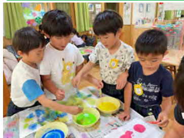
色が混ざって綺麗！！にじみ絵に挑戦

子ども自身の発見ややってみたい気持ちを大切にしていきたいです。環境作りから見直し、遊びの中で「楽しい！」と思えるように子どもたちと関わっていきたいです。“失敗は成功のもと”たくさん失敗しても前向きに葛藤できる子を育てたいです。