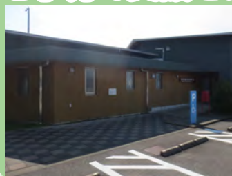
中央公民館敷地内 木のぬくもりあふれる児童館