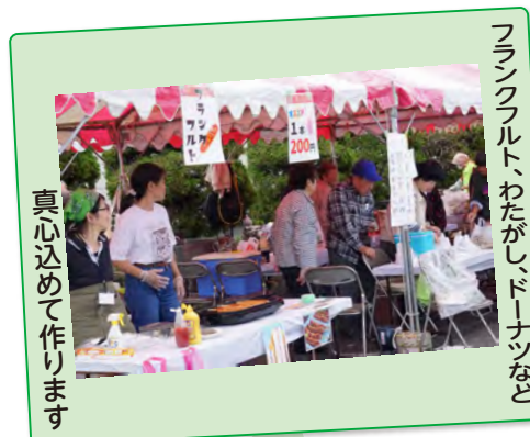
真心込めて作ります