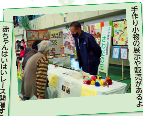
手作り小物の展示や販売があるよ