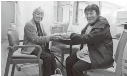
愛の家グループホーム