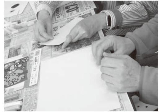
すな絵をしている様子