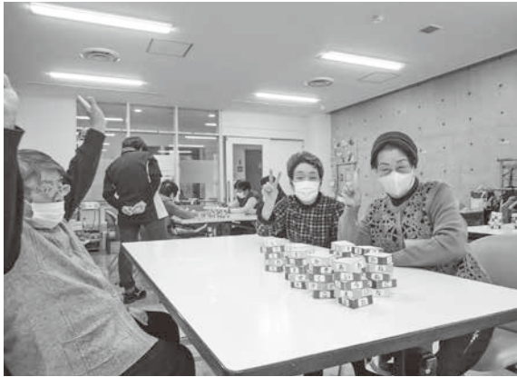
あいうえおタワー