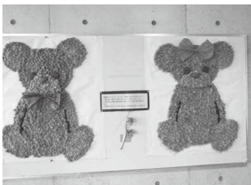
綿で作ったクマの壁飾り