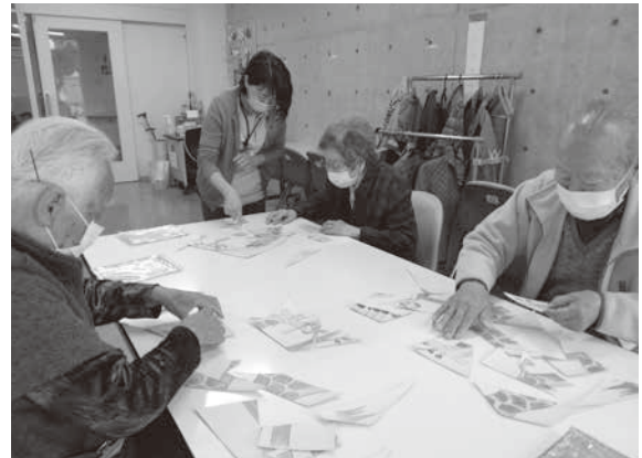
手作りパズルで脳トレ