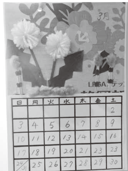
3月の手作りカレンダー