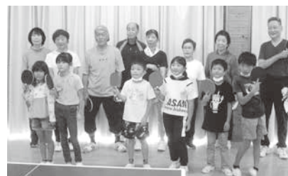
子ども達と楽しく卓球

卓球のチームはみんな勝ち負けにはこだわらず、「ネットがなければいいサーブが入っていたのに」などと卓球台を挟んでおしゃべりをしながら楽しくやっています。休憩中には仲間から漬物の漬け方や料理のコツを教えてもらったり、練習後には「うちの畑に寄って大根を抜いていきな」と声を掛けてもらったり、都会では考えられないような付き合いをさせてもらい、温かい人たちに恵まれて大変ありがたいことと感謝しています。楽しく笑顔でやっているのだから、これからも元気なうちは続けていきたいと思っています。