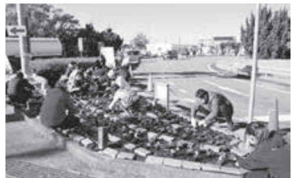
写真：おっ撮りカメラ隊

12月23日(土)に「ふれあい企画」を実施しました。この企画は障がい者と学生ボランティアが菊川インター前の美化活動を通して交流し、障がいへの理解を深め、地域福祉の推進を図ることを目的に、社会福祉法人Mネット東遠、社会福祉法人草笛の会、中日本高速道路株式会社、ボランティア等の協力を得て開催しています。今回は、高校生や大学生、一般の方の8人が参加されました。パンジーやビオラ等たくさんのお花を中日本高速道路株式会社から、葉牡丹を菊川市花の会からいただき、大勢の方の協力により素敵な花壇になりました。参加された方からは、「楽しく活動することができた」「とても良い経験ができ、この経験を活かしたりできたらいいなと思いました」等の意見をいただきました。お近くにお越しの際は、ご覧ください。