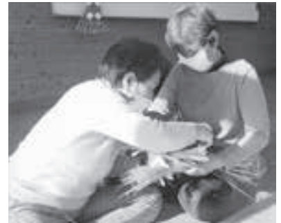
しめ飾り作ってる様子

A & B：ねえー、ちょっと来て、来て。左縄で編むのは難しいねえ。 私：そーだね。一度編んで、左右の手でぐっと引っ張るといいよ。 それに、掌が湿っていると力を入れやすいよ。 (しかし、なぜ左縄なんだろうか・・・と自問?) Bさん：なるほどねえ。やってみよ。 私：上手い、上手い。いいんじゃないの。