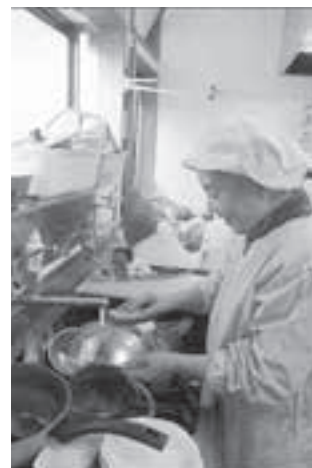
厨房の後片付けをしています

菊川に来て30年になりますが、その時に合唱を始め、今でも続けていま す。いくつかのグループで歌ってききましたが、現在は「ありがとう広め隊」 という合唱グループで歌っていて、月に2回練習をしています。メンバー は76人で、童謡などを歌っています。令和5年の4月に横浜みなとみらい ホールで開催された「第12回国際シニア合唱祭ゴールデンウェーブin横浜」 に出演しました。自由な服装で歌う姿が好評でした。