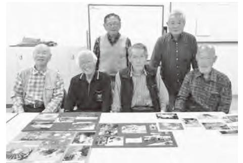
2023-11月の定例会 おっ撮りカメラ隊メンバー

社会福祉協議会から依頼されて福祉事業に関するイベント現場に出向き、年間20数件の催し物を記録撮影しています。デジカメ好きの諸氏が募られて2008年に発足し、長らく活動を続けてまいりました。趣味が活かされる嬉しさを感じながら、伝わる写真を撮ろうという変わらぬ思いで現場に臨んでいます。ボランティア団体としては異色な存在ですが、裏方としてご依頼に応えています。プラザけやき正面玄関ホールには月替わりで2L判写真を展示しています。日頃、各隊員が四季の風物などを撮ったものですが、写真を撮り続ける意欲を示したつもりです。ご覧になって少しでもホッとしたお気持ちになっていただければ幸いです。当隊にご興味のある方は是非とも月初めの定例会にお立ち寄りください。