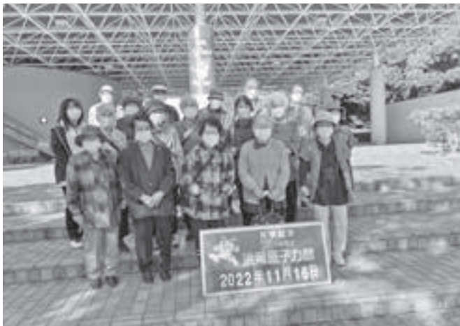
浜岡原子力発電所見学