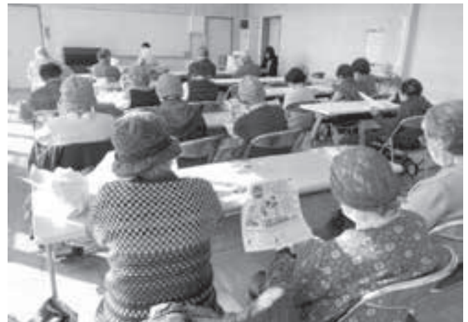
出前講座 騙されないコツ教えます