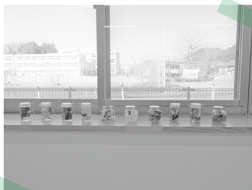
フワラーアレンジメント

参加者からは、「ここに来るまで勇気がいったけど、来て良かった」「私だけじゃなかった」「心が豊かに過ごせる」等の感想をいただきました。ひきこもりに関する学習会も、定期的で開催しています。参加を希望される方は、お問い合わせください。