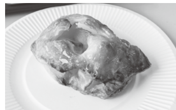
利用者さんと作ったアップルパイ

食べることが好きです。ついつい甘いものやおやつを食べたくなくなってしまいがちですが、食べ過ぎないように気を付けたいです。食べるだけではなく、料理ももう少しできたら良いなと思います。