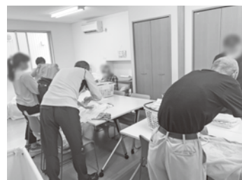
利用者さんとの作業の様子

私は令和5年5月から工房オアシスに異動してきたばかりで、作業のことはわからないことだらけだったのですが、周りの利用者さんたちが丁寧に教えてくださいました。初めて話す私にも親切に教えてくださって嬉しかったです。いつも、利用者さん同士でわからないことを教え合ったり、職員が間違えていると利用者さんが教えてくれたりすることもよくあります。それだけ皆さんが作業に対して責任感を持って、いきいきと働いているのだなあと感じています。