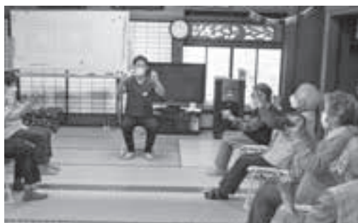
いつものサロン 手指体操

また、活動の中で色々な催し事を企画し、行います。踊り、楽器の演奏、仮装、劇等内容は多岐にわたりますが、皆さんに喜んでいただけると張り合いになりますし、芸の奥深さを感じるようになりました。まだまだ駆け出しですが、色んな事にチャレンジしていきたいと思えます。