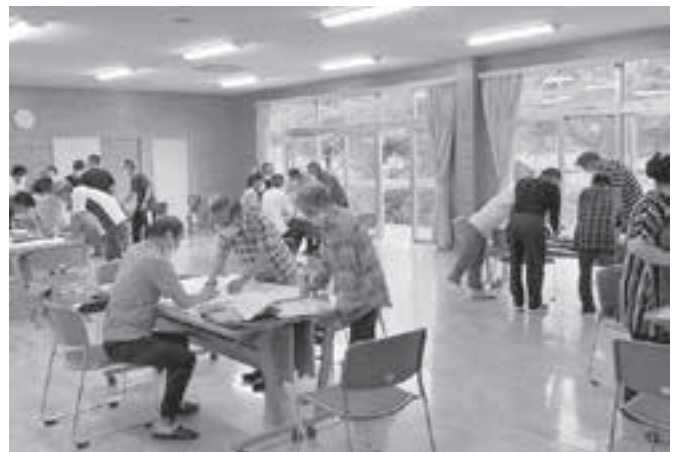
「福祉見守りマップ」

コロナ禍で実施が難しかった福祉講演会ですが、静岡県くらし環境部環境局の方が「リニア中央新幹線の南アルプストンネル工事」についてわかり易くお話をしてくださり、沢山の方に聴講していただきました。