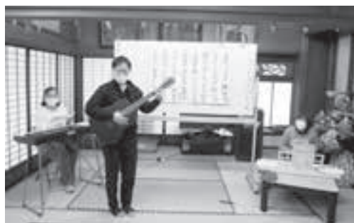
お楽しみ会 楽器の演奏