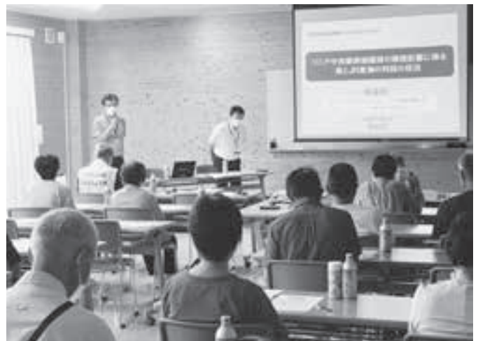
「リニア中央新幹線」講演会