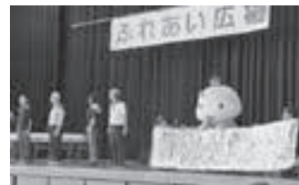
R元年開催の様子 (おっ撮りカメラ隊撮影)

開催日時 令和5年10月21日(土) 9:30~14:30(予定) 開催場所 菊川市民総合体育館 (菊川市赤土1070-1) 主催 菊川市ふれあい広場実行委員会・菊川市社会福祉協議会 参加対象 市内在住の方々によるグループや福祉団体など 対象内容 展示・体験教室・手作り品販売・ステージ発表など 注意 ふれあい広場の目的に相応しくない場合は、お断りすることもありますのでご了承ください。 申込締切 5月25日(木) 問い合わせ 菊川市社会福祉協議会 地域福祉係 ☎35-3724