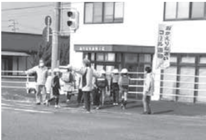
「お帰りなさいコール」

毎月第2水曜日、小笠東小一斉下校に合わせての「お帰りなさいコール」運動、「福祉見守りマップ作りや更新作業」、伝統行事を守ろう「地の神様作り」、「豆まき」などを行っています。