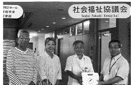
(菊川市フーバ協会)