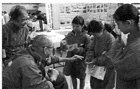
(ふれあい広場に於て)