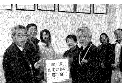
(明るい社会づくり運動菊川地区協議会)