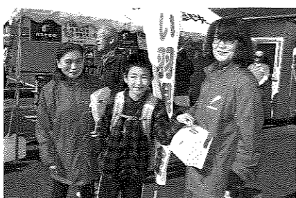
(みねだ会館まつりにて)